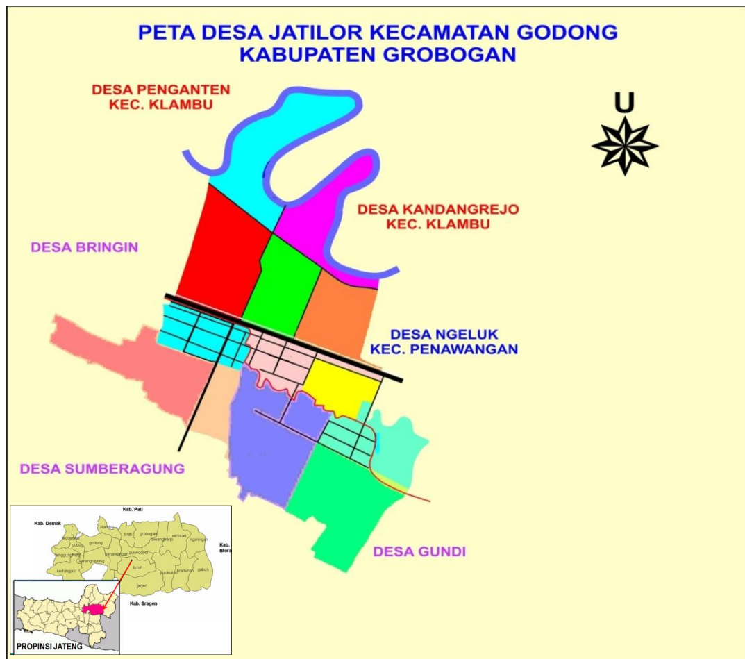
Gambar 2.1 Peta Lokasi Desa Jatilor Kecamatan Godong Kabupaten Grobogan