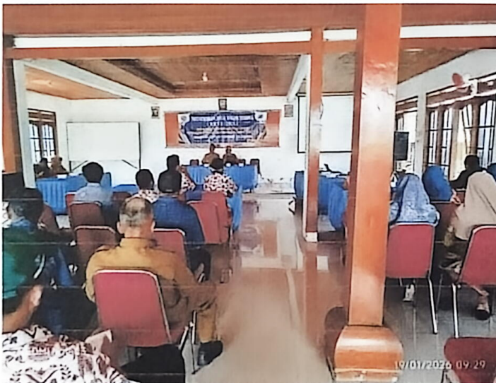
Musyawarah Desa Penyertaan Modal Bumdes dan Bumdesma