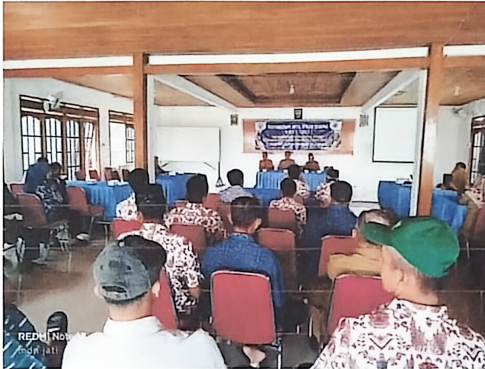
Musyawarah Desa Penyertaan Modal Bumdes dan Bumdesma